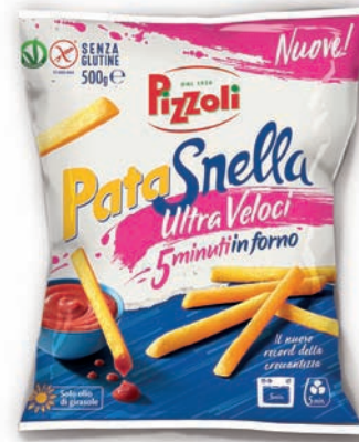
Le patate Patasnella Ultraveloci nella confezione da 500 grammi

ricetta il giusto equilibrio fra bontà e benessere. Pizzoli Rossana, Pizzoli Bianca e Pizzoli Aurea completano l'offerta di valore: si tratta di tre prodotti dall'elevato profilo qualitativo, frutto dell'accurata selezione delle migliori varietà di patate per le più amate destinazioni d'uso