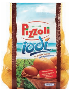
Le patate Pizzoli Iodi

in cucina, come la cottura in forno o la preparazione degli gnocchi. Non manca poi l'attenzione di Pizzoli per l'ambiente e la sostenibilità: le referenze sono confezionate in Sormapeel, una soluzione in grado di abbattere di circa il 20% il quantitativo di plastica impiegata rispetto alle tradizionali confezioni