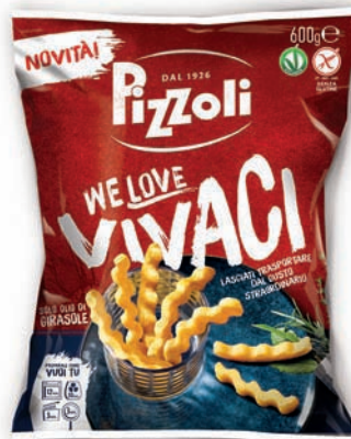
Le patate Pizzoli We Love Vivaci nella confezione da 600 grammi

non solo per le innovative tipologie di taglio, ma anche per le nuove ricette abbinare all'imprescindibile componente di servizio per una facile e rapida preparazione domestica. Proprio su questi ultimi driver si è focalizzato il percorso di innovazione che ha portato al lancio di Patasnella Ultraveloci, la patatina più veloce del mercato nella riattivazione in forno o in air fryer, e di We Love Vivaci, il nuovo bastoncino dall'esclusivo taglio ondulato e dal particolare gusto aromatizzato. Sul fronte della prima gamma, nel 2021 risulta un consolidamento delle performance conseguite dalla patata Iodi, un prodotto dalle caratteristiche uniche, genuino, gustoso e soprattutto fonte di iodio, in grado di garantire in ogni