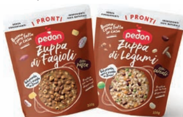
Le Zuppe, tra gli ultimi lanci

Prosegue così il percorso di crescita della marca Pedon, con l'obiettivo di continuare a proporre una visione evolutiva della categoria dei legumi e cereali, dalle proposte tradizionali, alle cotture veloci, fino ad arrivare ad alternative sempre più pronte che combinano praticità, salubrità e gusto, fattori sempre più decisivi per il consumatore nell'atto d'acquisto.