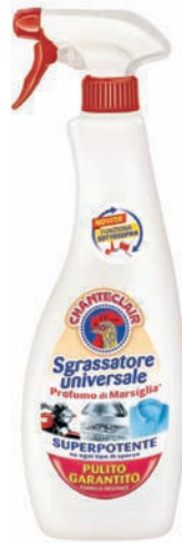
Chanteclair Sgrassatore Universale Marsiglia

Gruppo DESA, nato nel 1908 a Seregno (MB) come Saponificio Ambrogio Silva, oggi è una realtà primaria nel settore della detergenza casa e bucato e cura della persona, con un trend importante di crescita in Italia e all'estero. Brand forti, innovazione costante, attenzione alla qualità, ai bisogni emergenti dei consumatori, investimenti in ricerca e sviluppo e comunicazione sono i pilastri del suo successo e della sua continua crescita. Dopo anni di innovazioni e costante ammodernamento degli impianti e delle strutture produttive, a inizio anni Novanta la decisione di puntare sullo sviluppo dei brand di proprietà, dopo l'acquisizione di Spuma di Sciampagna nel 1989 e di Chanteclair nel 1995, seguite negli anni da altre acquisizioni strategiche, come Quasar e Sauber. La capacità di ascoltare il consumatore e portare innovazione nel mercato da sempre caratterizza l'azienda. Ne è un esempio Chanteclair, il brand di punta del gruppo, il cui successo si deve all'invenzione di un prodotto unico e rivoluzionario, lo Sgrassatore Universale Chanteclair, che ha creato la categoria stessa degli sgrassatori, della quale ancora oggi è leader assoluto con una quota di mercato del 46% (Fonte: Iri IS+Lsp+Casa