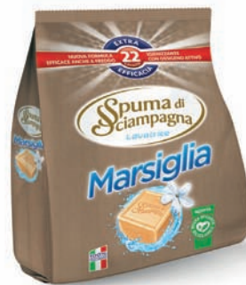
Spuma di Sciampagna polvere per lavatrice Marsiglia