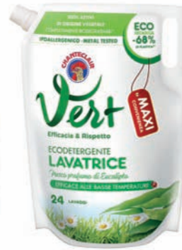
Vert di Chanteclair Ecodetergente lavatrice

toilette, AT febbraio 2022) e una notorietà complessiva del 100%. Un successo costruito negli anni grazie a una formulazione unica dalle prestazioni elevatissime e costantemente rinnovata. Nel 2021 inoltre Chanteclair ha introdotto un nuovo trigger in grado di erogare