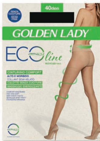
Le collant Golden Lady ECOline

e salvapiedi realizzati con Infynyl, filato che nasce da un processo di riciclo dei materiali di produzione, certificato dal Global Recycled Standard, che non prevede l'uso di materiali chimici, ma garantisce un basso impatto ambientale. Altro progetto di punta di Golden Lady è il collant Senza Cuciture che, dopo anni di studi e investimenti in tecnologia e R&D, ha rivoluzionato il mercato