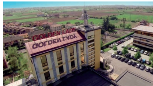
La sede di Golden Lady