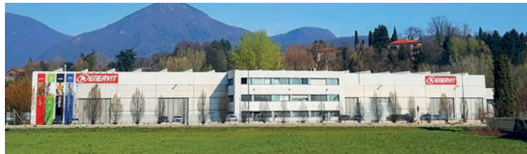
Lo stabilimento Enervit a Erba (CO)

alle materie prime - di altissima qualità, certificate e no OGM - collaborazione costante con esperti e campioni. Enervit ha l'ambizione di poter fare sempre la differenza, contribuendo allo sviluppo di nuove soluzioni e prodotti innovativi sempre più sostenibili. Una missione anche di governance (ESG) in accordo con le più rilevanti linee guida di sostenibilità a livello internazionale. Oggi Enervit è un'azienda leader in Italia (sede principale a Milano) e presente con i propri prodotti sui mercati internazionali. Grazie al forte senso di appartenenza al territorio, Enervit si è impegnata negli anni a sostenere e valorizzare