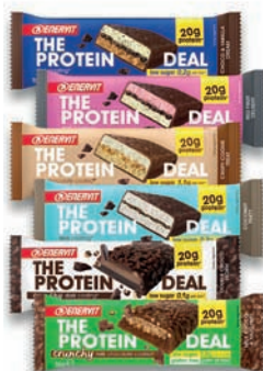
The Protein Deal

Viene applicata, inoltre, la Linea Guida ISO 26000 per la Responsabilità sociale dell'organizzazione. Lo spirito dell'azienda è fondato su valori come rispetto per il consumatore e i suoi bisogni, capacità di individuare e anticipare i trend, attenzione