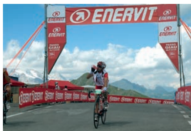
Un'immagine della Maratona Dles Dolomites di cui Enervit è storico partner