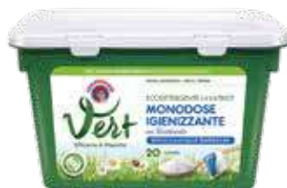
Vert di Chanteclair Lavatrice Monodose Igienizzante con Bicarbonato

Tutti questi prodotti, riuniti sotto il cappello della linea Forza&Igiene, rispondono al meglio alle esigenze più attuali del consumatore che oggi richiede sempre più la garanzia di un pulito profondo e igienizzato in tutta la casa. Anche nel core business dello sgrassatore l'innovazione non si ferma: Chanteclair rinnova il mercato degli sgrassatori universali montando sulle proprie confezioni un esclusivo trigger in grado di erogare perfettamente il prodotto anche capovolto,