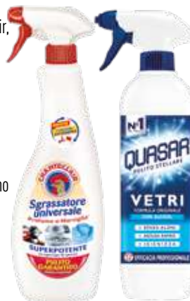
Chanteclair Sgrassatore Universale Quasar detergente Vetri

permettendo così di facilitare le pulizie, raggiungere agevolmente anche i punti più difficili da pulire ed usare il prodotto fino all'ultima goccia.