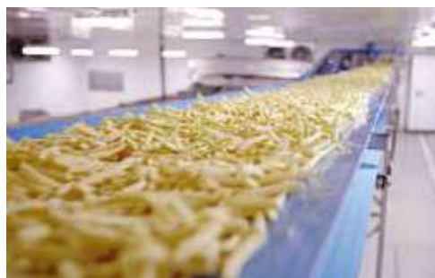
Lo stabilimento di produzione