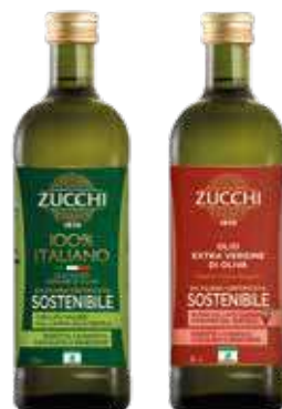
La gamma di oli di oliva da filiera certificata sostenibile Zucchi