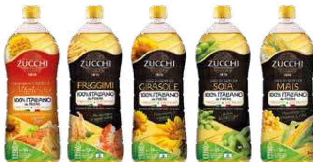
La gamma di oli di semi 100% italiani da filiera tracciata e certificata Zucchi

Come per le altre referenze della gamma, tramite QR code sarà possibile conoscere la sua origine. Lo studio di packaging sostenibile è uno degli ambiti in cui l'azienda è fortemente impegnata, proponendo delle soluzioni in grado di ridurre sensibilmente l'impatto