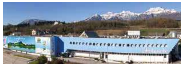
La sede dell'azienda a ridosso delle Dolomiti Bellunesi

quotidianamente anche nelle zone più difficili, tra le maestose Dolomiti. La natura di queste vallate rappresenta per la Cooperativa un'importante risorsa