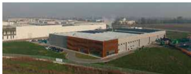
Il magazzino centrale Cedior nel Lodigiano

Cedior centro servizi e logistica ortofrutta