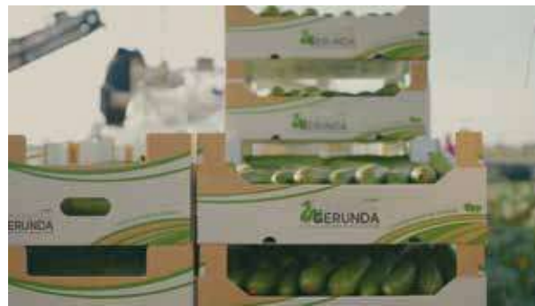
Lombardia Gerunda valorizza le produzioni di territorio

A partire dall'"amore profondo" per la terra e i suoi frutti, nel rispetto della natura e del pianeta, Cedior costruisce rapporti di fiducia e di rispetto con tutti i partner e con i consumatori finali. Etica e "fattore umano", onestà e persone, sono al centro della mission di offrire tutti i giorni ai consumatori il meglio della natura. La vocazione all'innovazione, il coraggio e l'ottimismo, accompagnano l'attività di selezione e valorizzazione di prodotti ortofrutticoli italiani e da tutto il mondo 365 giorni l'anno. A caratterizzare l'attività di Cedior facendone un partner superlativo è poi un sistema di distribuzione affidabile e puntuale con flotte selezionate di mezzi refrigerati certificati. Con una grande versatilità e modularità, Cedior si presta a realizzare progetti "tailor made" per i propri clienti o specifiche "filiera corte" e campagne agricole studiate in collaborazione con i clienti stessi. Nel paniere di una delle poche aziende che ha ideato diversi brand di prodotti ortofrutticoli, tra cui uno collettivo, ogni marchio ha il suo "perché", un posizionamento specifico e un benefit differente. Elisir, per esempio è la selezione di qualità, quotidiana, del proprio negoziante di fiducia con un'ampissima gamma di prodotti ortofrutticoli. In questo contesto si colloca anche Lombardia Gerunda, un progetto di aggregazione e appartenenza che nasce dalla visione di Gianluigi Cugini, Direttore Generale di Cedior Srl, con