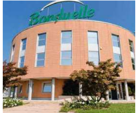
La sede principale a San Paolo d'Argon in provincia di Bergamo

La Rucola IGP proveniente dalla Piana del Sele, uno degli ultimi lanci