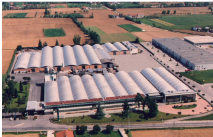
Una veduta aerea dello stabilimento di Onara (Pd).