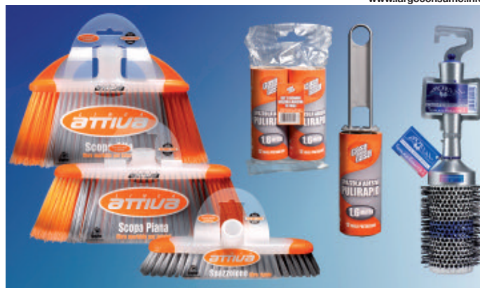
Alcuni prodotti del vasto assortimento I.P.P.A.