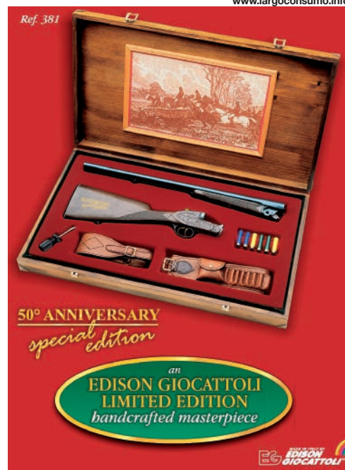
La doppietta "Montecarlo" in edizione limitata per il cinquantenario dell'azienda.

rie di automodelli diecast 1:43 denominati "Serie Oro", che vengono presentati in un pack specifico e sono un ideale trait d'union tra il giocattolo e il collezionismo. Tutto il catalogo Edison, comprese le news e le anticipazioni, è consultabile su www.edisongiocattoli.it . Un ambiente motivato e coeso completano il profilo di questa interessante e a suo modo "unica" realtà italiana.