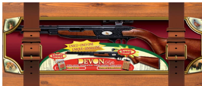
Il fucile Devon è un'altra "chicca" tecnologica lanciata in occasione dei 50 anni di Edison.