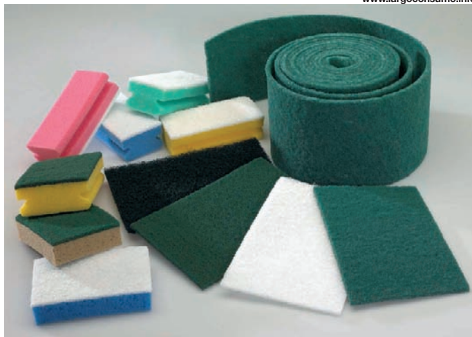
Qui sopra, un assortimento dei prodotti Corazzi Fibre. In basso, la sede dell'azienda.

La costante ricerca di innovazione e qualità e una marcata vocazione internazionale, sono gli elementi che caratterizzano l'attività di Corazzi Fibre, ormai da più di mezzo secolo di attività. Protagonista da sempre del settore delle fibre abrasive, l'azienda ha assistito all'evolversi del mercato negli ultimi decenni, rispondendo al mutare delle esigenze e anticipando le nuove tendenze: dalla lana d'acciaio degli anni Cinquanta e Sessanta, alle fibre abrasive a base di tessuto non tessuto degli anni Settanta e Ottanta, fino alle recenti evoluzioni dei materiali e delle soluzioni pensate per entrare a pieno titolo nei nuovi segmenti di mercato della pulizia professionale e degli impieghi industriali. L'ultima linea di produzione, altamente tecnologica, ha permesso recentemente di completare la gamma con fibre di altissima qualità e di aumentare la capacità produttiva in modo da