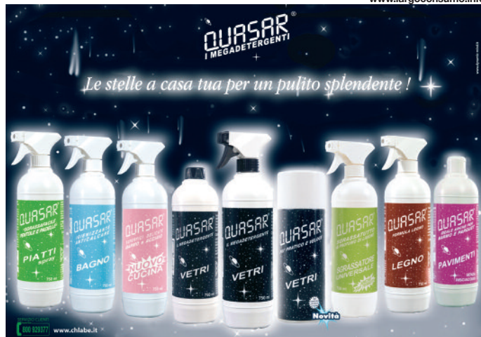
Una immagine della campagna stampa dedicata alla linea Trigger.

con una quota a valore dell'8,6%, non cannibalizzato dalla novità di linea, Quasar Vetri Spray . Quest'ultimo è una nuova stella nell'universo Quasar, per un pulito ancora più splendente: si presenta come una schiuma altamente performante, in una bomboletta da 400 ml, studiata per ottenere vetri perfettamente puliti e brillanti, senza aloni, ancora più pratico e veloce; non cola e aderisce alle superfici, evitando sprechi; ottimo anche per tutte le superfici lavabili come piastrelle, acciaio, laminati, cromature e marmo. A fronte della frequenza d'impiego con cui si rendono necessari, è fondamentale che i detergenti per le piccole superfici puliscano efficacemente senza bisogno di ri-passare con acqua, per rendere molto più rapida la pulizia quotidiana. Per questo, nella Linea Casa l'azienda propone due restyling. Quasar Cucina , detergente neutro multiperformante, studiato in particolare per superfici delicate come marmo e acciaio con un piacevole profumo agrumato, ideale anche per frigoriferi, piani cottura, lavelli e rubinetterie, coniuga la detergenza all'eliminazione dei cattivi odori e a un effetto