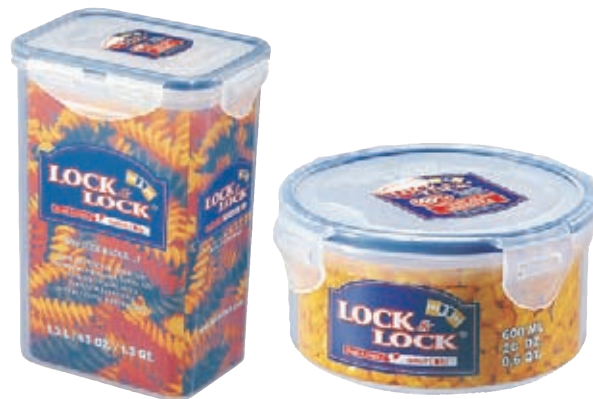
Due articoli della linea Lock&Lock®, di cui Bergamaschi & Vimercati ha assunto la distribuzione in esclusiva per l'Italia.

di Excelsa. Bergamaschi & Vimercati punta molto su Excelsa in chiave di business, ma anche di immagine. Non a caso, per dare alla sua vocazione all'innovazione i contenuti più efficaci, l'azienda ha deciso un importante investimento, dotandosi recentemente di un ufficio design interno, che cura il concept e l'elaborazione estetica degli articoli. A parte Excelsa, il 2006 è stato caratterizzato da una grande novità: Bergamaschi & Vimercati ha acquisito la distribuzione in esclusiva di Lock&Lock®, un'innovativa linea di contenitori per alimenti prodotti dall'azienda coreana HanaCobi. Eccezionali performance coperte da brevetti internazionali, materie prime di alta qualità, grande praticità ne fanno prodotti unici sul mercato.