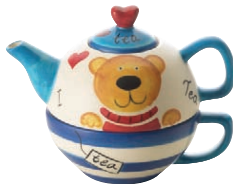
La teiera con tazza Tea For One, una simpatica proposta per il sempre più ampio target dei single.

N el contesto dell'ampissimo assortimento Bergamaschi & Vimercati, spicca la linea Excelsa, lanciata all'inizio del nuovo millennio e costantemente arricchita nel tempo, poiché ben rappresenta la filosofia imprenditoriale e la strategia di approccio al mercato della società lombarda. Excelsa è stata concepita con una mission ben definita, ovvero soddisfare un consumo quotidiano, offrendo prodotti ideali per un uso "day by day", ma pur sempre di ottimo livello: in altre parole, un mix vincente tra qualità dei materiali impiegati, cura nella presentazione e nel packaging, funzionalità e prezzo. Sono molti i "plus" di Excelsa, a cominciare dall'ampiezza di una gamma che si compone di oltre 2.000 articoli e ogni anno è arricchita con 300-500 nuove referenze. Uno sforzo non indifferente ma necessario, per emergere in un mercato che risente di mode, stili, tendenze e impone quindi una costante creatività. Non a caso, l'azienda realizza ben due cataloghi all'anno in occasione delle due edizioni del Macef. Va sottolineato che Bergamaschi & Vimercati è attenta non solo a presidiare i periodi promozionali con proposte a elevata rotazione, ma anche a sviluppare linee "a tema": la prima colazione, il cocktail, la tavola estiva, ecc. La presenza costante degli articoli a magazzino, una logistica rapida, un'assistenza accurata sul pdv completano i plus