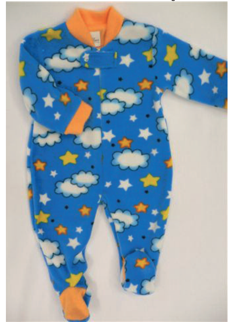
Un modello dell'ampia offerta dell'azienda barese.

Il pigiama firmato Ines è destinato a un pubblico senza limiti di età, a cui piace vestirsi alla moda in pieno comfort domestico, acquistando un arti-