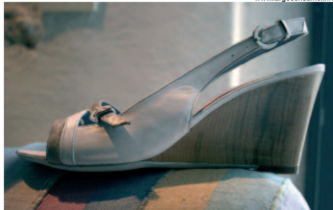
Due modelli dell'assortimento dell'azienda veronese.

L'azienda è attiva con diversi brand: Freemood , nato nel 2006 per lo sviluppo del mercato italiano con collezioni giovanili e trendy, dedicate una all'uomo e due alla donna; Canguro , marchio storico in Italia per le calzature da bambino, nato nel 1966 e acquistato da Effegi nel 2005, conta tre collezioni: Casual, Sport e Mare; CGO identifica