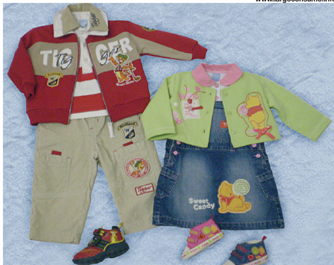
Due immagini dell'ampio assortimento dell'azienda lombarda.

cessori per neonati, bambini e ragazzi di età compresa tra zero e 14 anni: abbigliamento casual e sportswear (T-shirt, felpe, tute jogging, jeans, maglioni, giubbotti); grembiuli scuola ; beachwear (costumi, parei, ciabatte mare); abbigliamento intimo giorno e notte (body, slip, boxer, canottiere, pigiami e camicie da notte); calzature (scarpe, sandali, stivali, ciabatte e pantofole). Dal 2001 il Gruppo si avvale della partnership di Walt Disney Company, essendo titolare di una licenza Disney che copre tutta la gamma produttiva di Arnetta-Polifin e che riguarda tutti i personaggi principali di Disney, compresi quelli dei film più recenti. Dal 2006 la licenza Snoopy per tutti i personaggi Peanuts si affianca alla produzione tradizionale, mentre di più recente acquisizione sono le licenze Spider-man, Geronimo Stilton e Acqua in Bocca. Arnetta-Polifin propone quattro collezioni annue: primavera,