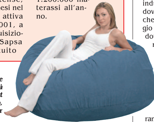
A destra, un'immagine di Z-Sac™, una novità all'insegna del comfort e della praticità; sotto, i due guanciali Contour (a sinistra) e Pulp.

nel 1929 nell'ambito del Gruppo Pirelli. Leader mondiale nei materassi in lattice, Sapsa ha mantenuto in licenza il marchio Pirelli-Bedding anche dopo il distacco dal Gruppo, avvenuto nel 1992. La capacità produttiva dei due stabilimenti europei - a Silvano d'Orba (Al) e Saleux-Amiens, in Francia - si attesta sui 1.200.000 materassi all'anno.