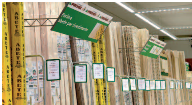
In alto, un esempio di allestimento e grafiche espositive; in basso, uno scorcio dei sistemi per un'esposizione ordinata degli articoli.

Agli alti standard produttivi, l'azienda affianca tutta una serie di servizi studiati per soddisfare al meglio, attraverso strumenti moderni, le