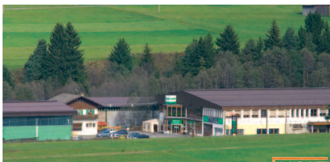
Lo stabilimento Pircher di Dobbiaco (Bz).

La cultura, la qualità, la tecnologia del legno: proposte e sistemi vincenti per il moderno fai da te