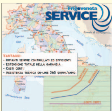
Assistenza tecnica in telegestione garantita 365 giorni/anno.

po reale, con la massima flessibilità. In particolare, vale la pena sottolineare che i tecnici possono prevenire gli eventuali problemi, successivamente intervenire attraverso la telegestione e, solo nel caso sia strettamente necessario, inviando in loco un tecnico. In quest'ultimo caso il costo sarà comunque contenuto, in quanto si tratterà di un intervento estremamente mirato, già preparato in sede. Inoltre viene proposto un contratto di manutenzione forfettario, la cui cifra, certa e omnicomprendente, si può mettere a budget con sicurezza all'inizio dell'anno. L'azienda solleva i clienti anche da tutte le incombenze come la periodica stampa tabelle legate all'Haaccp. Senza dimenticare che, attraverso una chiave USB fornita da FrigoVeneta Service, i clienti possono visualizzare il loro impianto su qualsiasi pc connesso a Internet: un'altra opportunità che valorizza un servizio già molto accurato.