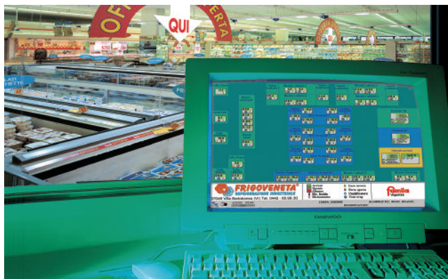
Sistema di controllo e supervisione dell'intero punto vendita.

L'azienda è specializzata nella progettazione e realizzazione - al 100% al proprio interno - di impianti frigoriferi. Grazie al know-how tecnologico accumulato in quasi 30 anni di esperienza, alla capacità di fare innovazione, alla competenza dei propri tecnici, FrigoVeneta soddisfa le esigenze di refrigerazione dell'industria e della gd.