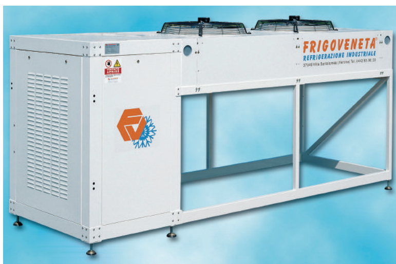
Unità frigorifere con condensatore incorporato e quadro elettrico integrato. Adatte a essere installate all'esterno senza necessità di copertura o protezioni.

vizio di assistenza. L'azienda veneta ha fatto del binomio prodotto/servizio il proprio obiettivo principale. Basti pensare che tutti gli impianti sono progettati e creati al 100% da FrigoVeneta: dalle centrali frigorifere ai quadri elettrici, dagli applicativi software che regolano l'automazione al sistema di supervisione e monitoraggio degli impianti. FrigoVeneta è stata tra le primissime aziende ad aver introdotto questo sofisticato sistema di monitoraggio a distanza: un plus in grado di fare la differenza, tant'è che nel 2006 la società ha varato una divisione servizi - FrigoVeneta Service -