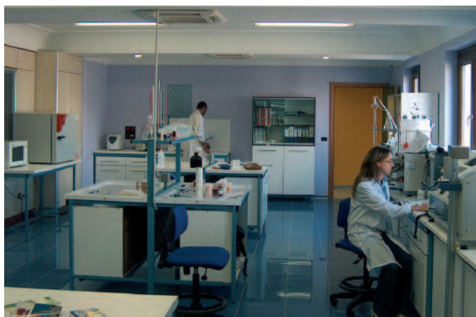
Uno scorcio del laboratorio del Centro Ricerche dell'azienda.

Di questo format l'azienda Ipafood si è assicurata lo sfruttamento del marchio su tutte le confezioni a garanzia di risultati sempre perfetti in ogni esecuzione casereccia.