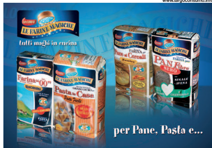
Alcuni prodotti dell'ampio assortimento delle "Farine Magiche Lo Conte".

L'alta qualità riconosciuta e la consolidata esperienza nel settore, fanno dell'azienda un punto di riferimento irrinunciabile per tutta la grande distribuzione. Il più vasto assortimento in Europa di specialità a base di farine particolari e una gestione capillare sul territorio, con una affidabile rete di merchandising, contribuiscono a fidelizzare un numero sempre maggiore di consumatori verso referenze ad alto contenuto di servizio, a vantaggio di tutto il settore e dello stesso punto di vendita, che vede incrementato il valore e il livello di servizio offerto. Un centro di ricerca di 1.000 mq con attrezzature di analisi all'avanguardia, una sala prove con elevati standard tecnologici, un team di giovani ricercatori