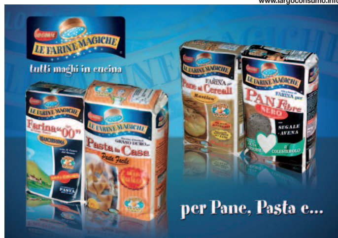
Alcuni prodotti dell'ampio assortimento delle "Farine Magiche Lo Conte".