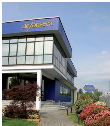
De Fonseca: la sede di Leini (To).