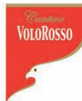
I marchi Caviro.