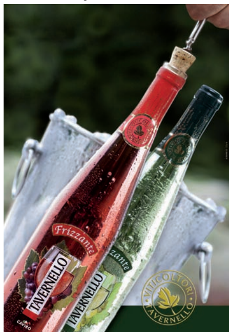
Tavernello Frizzante Bianco e Rosato, grandissimo successo 2010 di Caviro.

In Italia, negli ultimi anni Caviro ha saputo imporsi anche nel comparto della bottiglia da 0,75 l, grazie a marchi come Botte Buona e Brumale , entrando fra le prime aziende del comparto vetro: dal 2010 la sua gamma si è ampliata al settore Premium, grazie