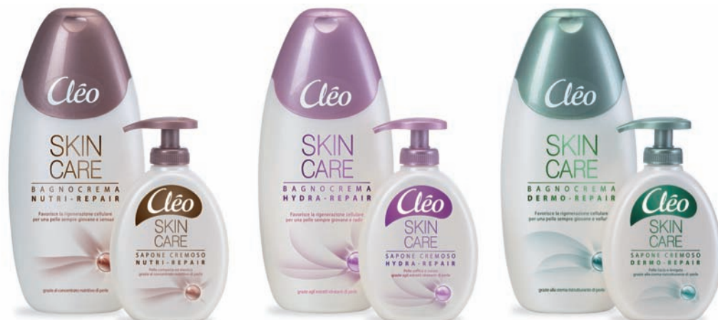
La linea Cléo Skin Care, lanciata lo scorso autunno.

Pagliari Profumi spa S.S. N. 10 per Genova Km 98 15100 Alessandria Tel. 0131.213511 www.pagliari.com info@paglieri.com