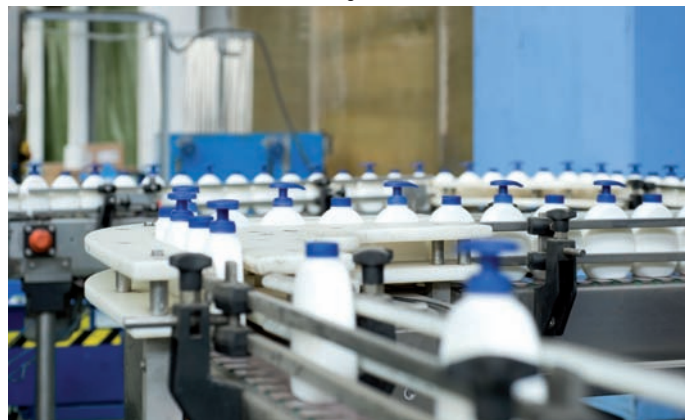
Uno scorcio di una linea produttiva.

P ortabandiera di Pagliari Profumi nel mercato della cura e benessere del corpo femminile, Cléo ha saputo coniugare con efficacia qualità funzionali e gratificazione sensoriale: un mix di grande impatto sul target femminile giovane. Basti pensare alla linea di Doccia-crema Cléo Yogurt, proposta nelle versioni "gourmand" Cioccolato, Vaniglia, Frutti Rossi, Zuccherini, Crema Pasticcera e Toffee Liquirizia. Con Cléo Skin Care , Pagliari propone una linea di bagno-crema e saponi cremosi dedicata alle donne alla ricerca della propria bellezza. Prodotti dalle profumazioni sofisticate ed eleganti, che favoriscono la naturale rigenerazione dell'epidermide, grazie ai principi attivi cosmetici racchiusi nelle perle. Cléo Skin Care si caratterizza quindi con una promessa di