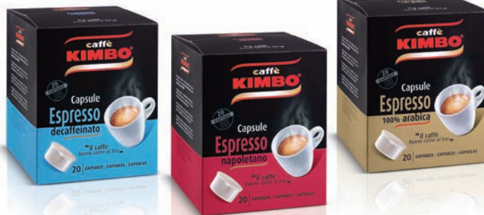
Le capsule di Caffè Kimbo: un prodotto di successo.

Caffè Kimbo è presente in molti importanti mercati stranieri. Tra questi vi è la Francia, con una distribuzione più ca-