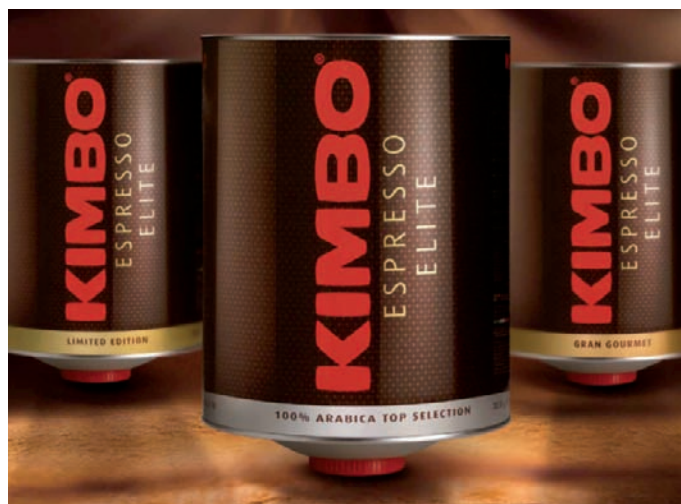
Kimbo Elite, le miscele destinate ai locali top.

Café do Brasil Via Appia km 22,648 80017 Melito di Napoli (Na) Tel. 081.7011200 www.cafedobrasil.it info@kimbo.it