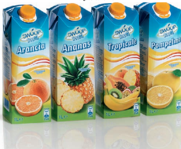
La nuovissima linea di nettari e succhi 100% a marchio Swoop proposti nel brick "Combifit Midi"

Il tradizionale ruolo da sempre svolto da Boschi Food & Beverage su tutta la filiera del pomodoro è rappresentato con fierezza dal marchio Pomì, che rimane sempre simbolo di alta qualità e prestigio. Gli alti standard qualitativi che il mercato richiede continuano a essere di stimolo per un marchio che deve continuamente evolversi: la nuova linea Tetra Recart, recentemente installata, ha visto proprio Pomì essere il primo prodotto a usufruire dei vantaggi della tecnologia. Non sono da meno gli investimenti nelle linee asettiche del PET, oggi ben rappresentati e premiati dal marchio "1due3", destinato alla linea premium dei succhi di