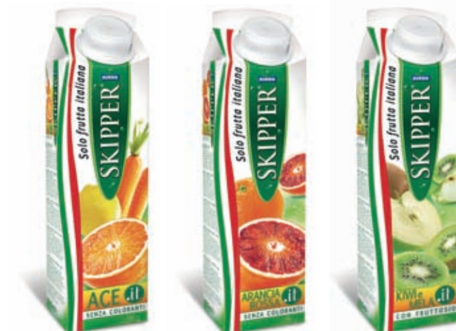
I nuovi Succhi.it formato elopack.