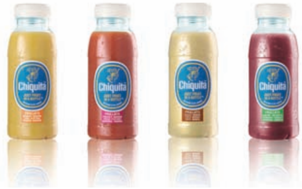
I Frullati 10 e lode, la grande novità 2009 firmata Chiquita.

in Italia con il bollino blu. La novità firmata Chiquita per il 2009 in Italia sono i Frullati 10 e lode, che segnano l'entrata dell'azienda nel settore della IV gamma di frutta italiana, dopo i successi registrati in tutta Europa con questi nuovi prodotti. Presentata lo scorso ottobre agli operatori della gdo, la nuova linea si compone di quattro referenze all'insegna della naturalità, realizzate unicamente con frutta fresca frullata e spremuta e leggermente pastorizzata. Nessuna aggiunta di zucchero, acqua, additivi, coloranti, conservanti e concentrati: i nuovi Frullati Chiquita sono fatti solo con frutta fresca, selezionata secondo gli standard di qualità con cui l'azienda sceglie i suoi prodotti. Con una shelf life breve, i Frullati 10 e lode vanno conservati nel banco fri-