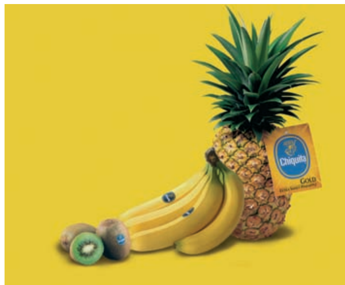
L'offerta della frutta con il bollino blu sul mercato italiano.