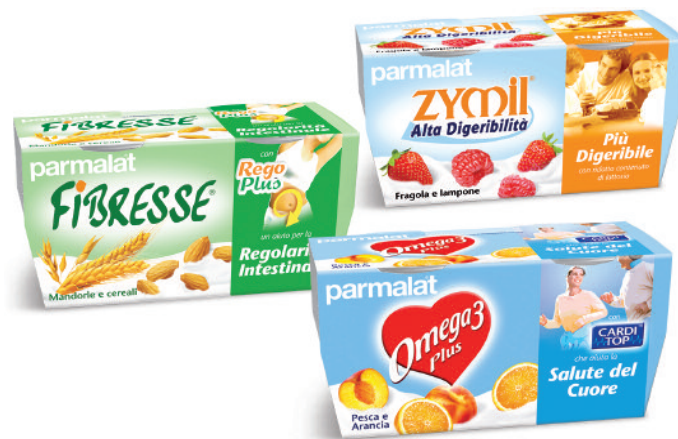
Le tre novità funzionali al cucchiaino.