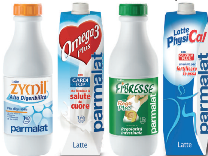
Parmalat vanta un'ampia offerta di latti funzionali.

Il latte Fibresse è un prodotto parzialmente scremato, addizionato di Regoplus, un mix di fibre naturali, biotina e vitamina E.