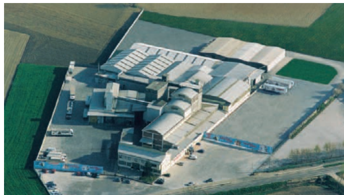
Un'immagine dello stabilimento Morando di Andezeno (To).